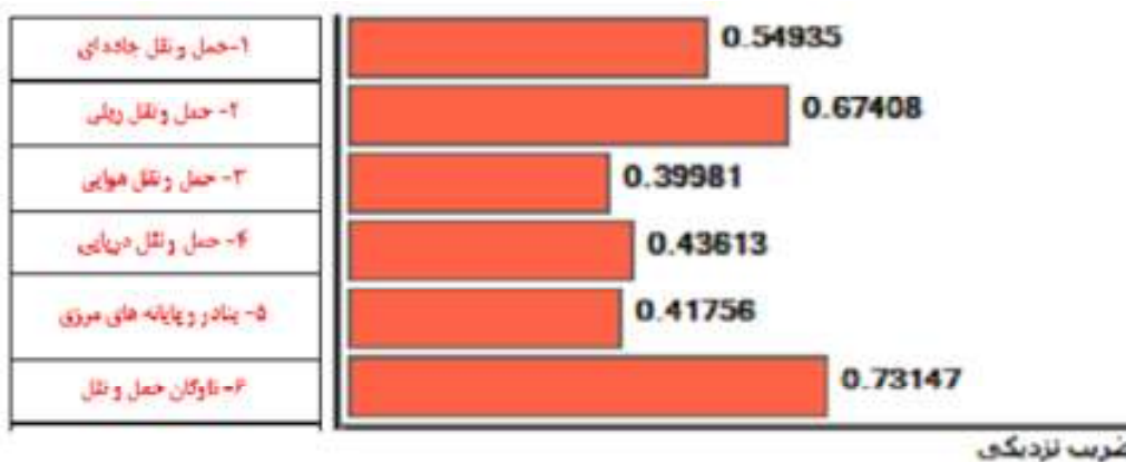
شکل ۱. نتایج حاصل از تحلیل

شاخص های اقتصاد مقاومتی به کمک روش تاپسیس است که با توجه به نتایج بدست آمده، بخش ناوگان حمل و نقل با اختلاف زیادی نسبت به سایر گزینه ها در اولویت قرار دارد. استفاده از ناوگان حمل و نقل عمومی با امکانات و تجهیزات پیشرفته نه تنها باعث کاهش مصرف سوخت و انرژی می شود بلکه با ایجاد امنیت و رفاه مسافران، باعث می شود که استفاده از حمل و نقل عمومی بیشتر شود. متأسفانه ناوگان حمل و نقل فرسوده، مصرف سوخت را که فرآیند تولید آن هزینه هنگفتی را به کشور وارد می کند افزایش می دهد برای نوسازی ناوگان حمل و نقل عمومی